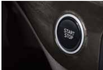
버튼 시동 & 스마트키