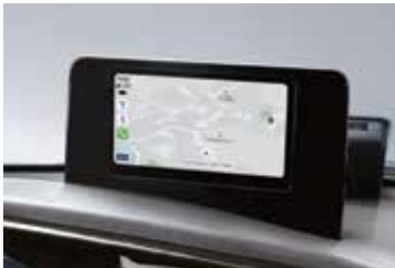
8인치 디스플레이 오디오(폰 프로젝트)