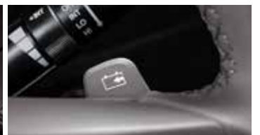
회생제동 컨트롤 패달쉬프트