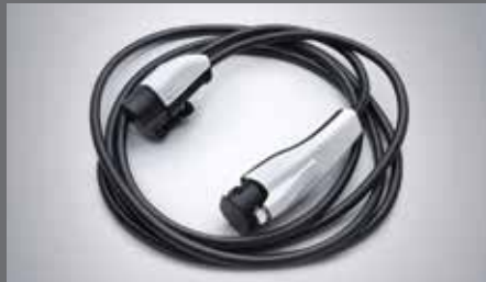
5핀 완속 충전 케이블