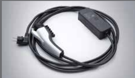
220V 후대용 완속 충전 케이블

※ 커스터마이징 상품 애프터마켓 판매처 - 현대 Shop(Shop.Hyundai.com) 현대 브랜드관