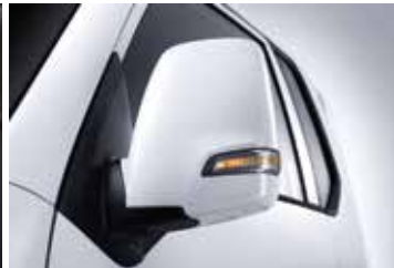
바디컬러 아웃사이드 미러(방향지시등)