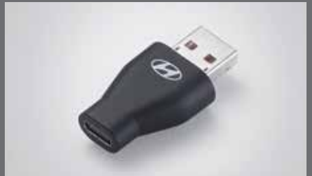
A to USB-C 변환 젠더

※ 220V 후대용 완속 충전 케이블은 의도치 않은 차량의 방전으로 인한 문제를 예방하기 위한 부품으로 일반 콘센트에 충전 시 전기차 요금제가 적용되지 않아 경우에 따라 전기 요금이 과도하게 발생할 수 있으니 완충 목적으로의 사용을 자제해 주시기 바랍니다.