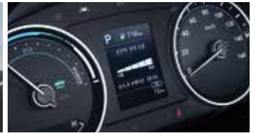
운전자 주의 경고