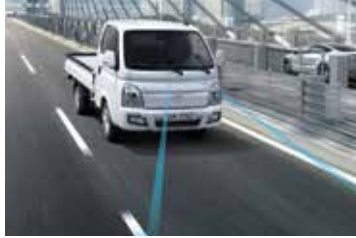
전방 충돌방지 보조, 차로 이탈 경고