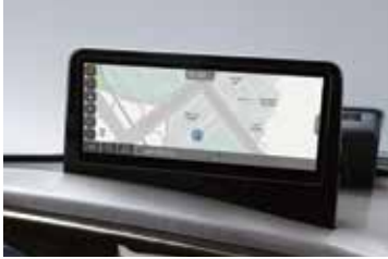
10.25인치 내비게이션(폰 프로젝트, 블루링크 포함)