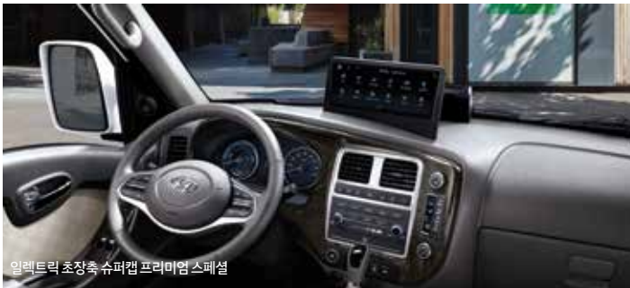
일렉트릭 초장속 슈퍼캡 프리미엄 스페셜

10.25인치 내비게이션, 풀오토 에어컨, 전동식 파워스티어링(R-MDPS), USB 충전단자