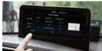
블루링크, 폰프로젝션, 현대카페이