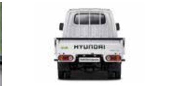
후방 모니터, 후방 주차거리 경고, 후진 경고음 발생장치