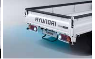
후방 주차거리 경고