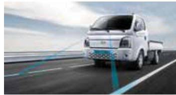
전방 충돌방지 보조/차로이탈 방지 보조