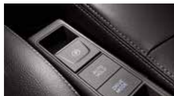
전동식 파킹 브레이크