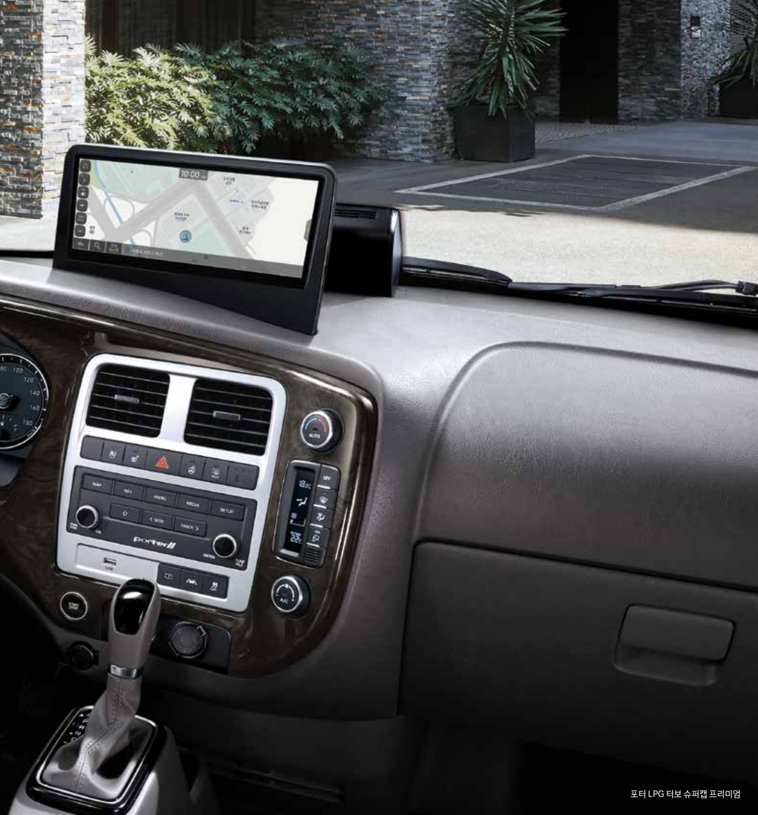
포터 LPG 터보 슈퍼캡 프리미엄